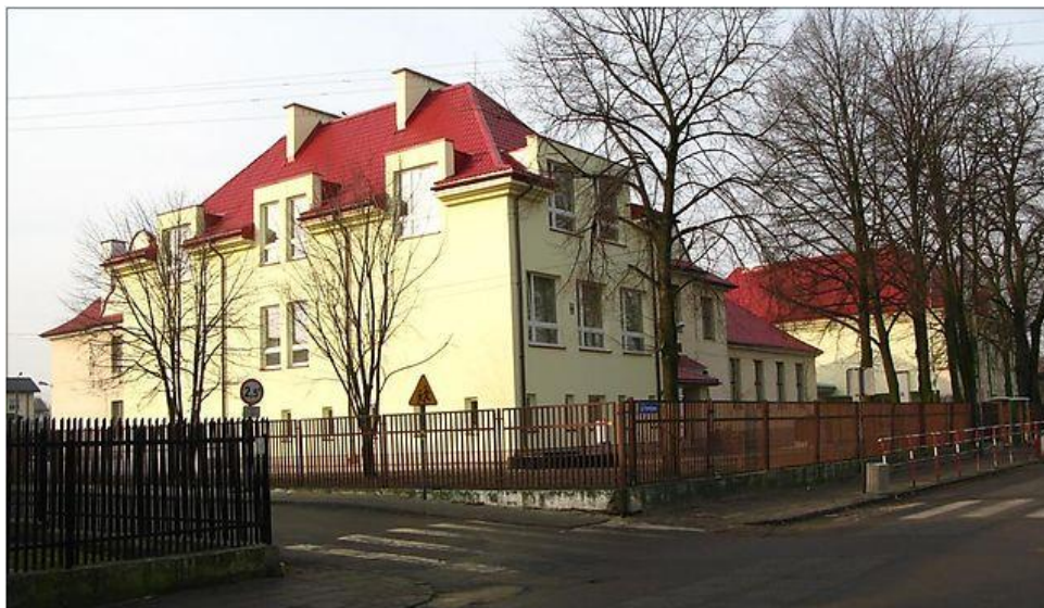
Budynek szkoły - widok od strony ulicy Pomnikowej

Główny budynek jest przy ul. Pomnikowej 21 w Markach.