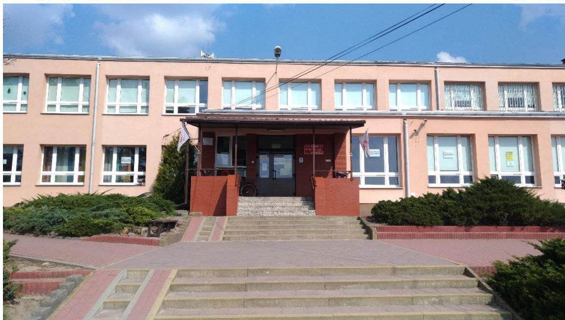
Wejście do szkoły - widok od strony ulicy Dużej

Druga lokalizacja szkoły znajduje się w budynku na ul. Dużej 3.