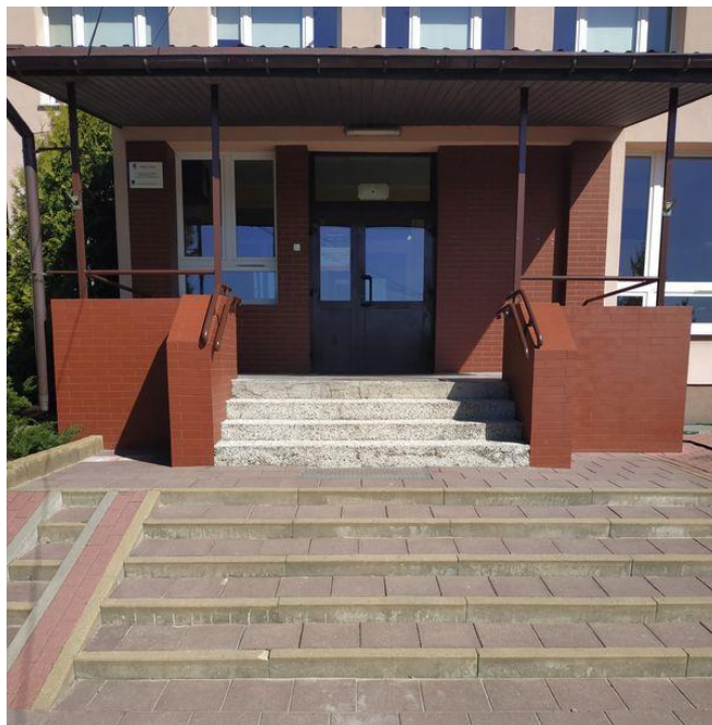
Wejście do szkoły – widok od strony Dużej

Wchodzisz głównym wejściem od strony ulicy Dużej.