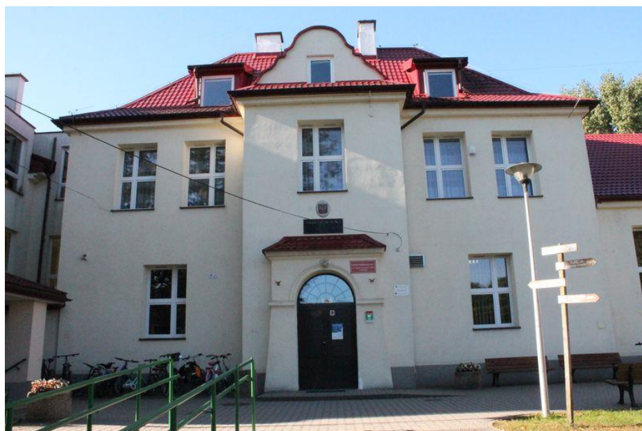
Wejście główne do szkoły – widok od strony ul. Pomnikowej

Budynek ma dwa wejścia od strony ulicy Pomnikowej.