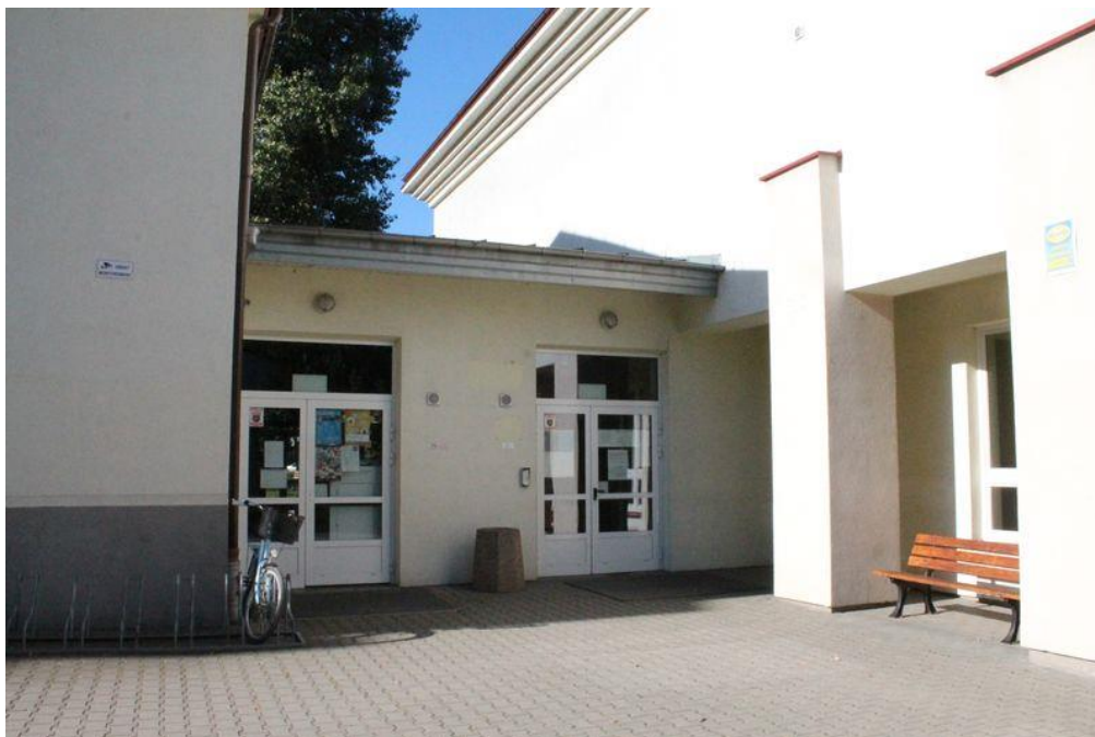
Drugie wejście do szkoły od strony biblioteki – widok od strony ul. Pomnikowej To wejście jest odpowiednie dla osób niepełnosprawnych, starszych i dla mam z dziećmi.

Druga lokalizacja szkoły znajduje się w budynku na ul. Dużej 3.