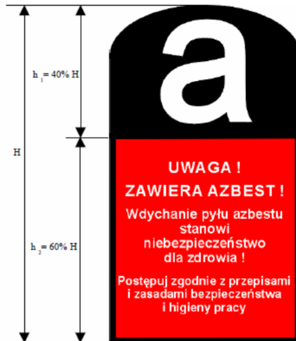
Rycina 3. Wzór oznakowania wyrobów i odpadów zawierających azbest