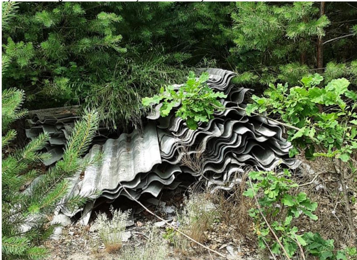
Rycina 2. Nielegalne składowanie wyrobów azbestowych

wydzielonych częściach składowisk odpadów innych niż niebezpieczne i obojętne albo na podziemnych składowiskach odpadów niebezpiecznych.