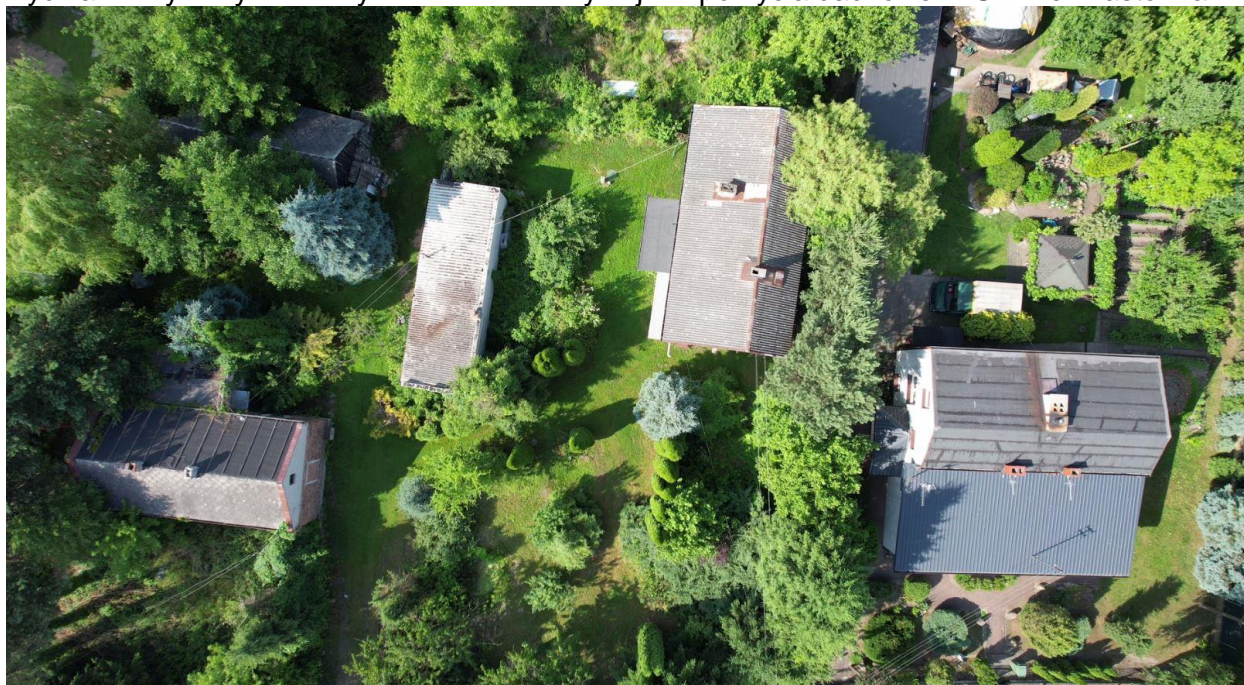
Rycina 1. Wykorzystanie wyrobów azbestowych jako pokrycia dachowe w Gminie Miasto Marki